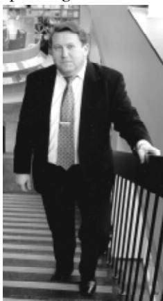
Fastighetsdirektören med miljarderna 1997.