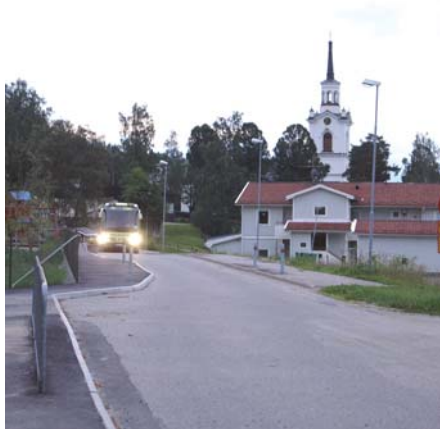
Sista "Anna Norbergs" bussen ankommer till slutstationen Liden måndagen den 30 juni 2008 kl. 22.47.