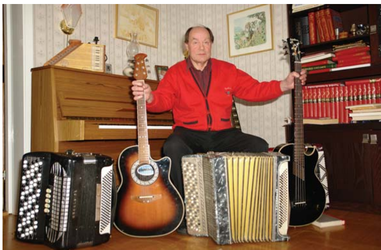
Tage med sina kära instrument 2008.

Ingers sjukdom och bortgång i december 1982 förändrade mycket i Tages liv. Taxirörelsen sål-