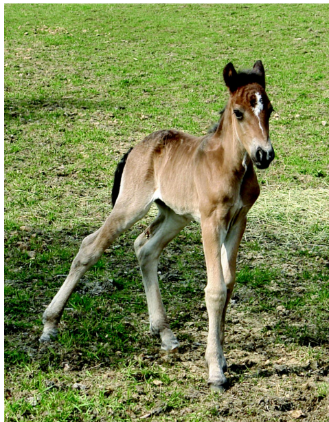
Sillre Man.

OBS 3: Är det dags för en ny rekordhäst? Denna gång i Sillre? Onsdagen den 2 maj 2007 klockan 00.30 föddes i Sillre ett hingstföls hos ägarna