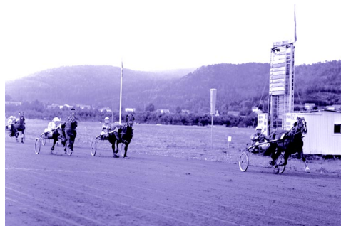
16-åriga Plurus vinner en av sina allra sista segrar på Solänget 1964, klart före Hamra med vitklädd körsven. Ur boken Stjärntravare, Århundradets travhästar i ord och bild.