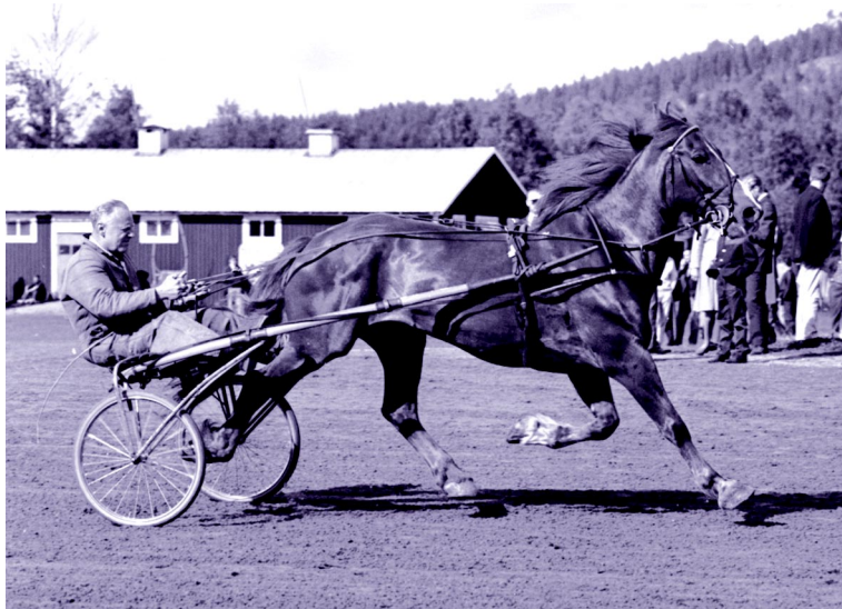
Ett legendariskt tävlingsekipage – Paul Oscarson och Plurus.