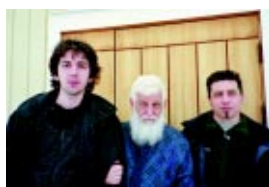
Vänner från Sicilien