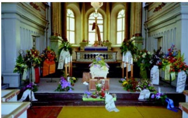
Begravningsgudstjänst för Rolf Lidberg fredagen 11 mars 2005 i Lidens kyrka