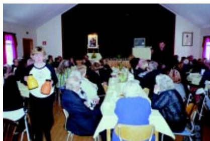
Minnesstund i Skansborg, Järkvissle